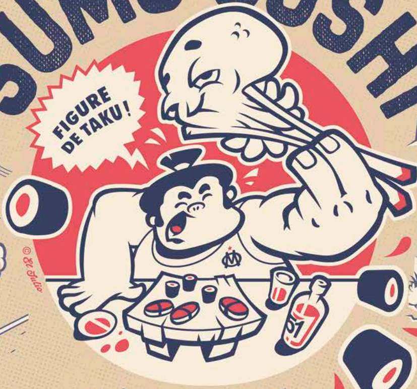
FIGURE DE TAKU!